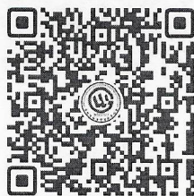
(香港路线报名二维码)

报名，每人限报 1 条路线。考察人员未能确定时间的，请不要随意扫码占用考察名额。