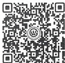
(深圳路线报名二维码)

深圳路线均为免费路线，不收取任何费用，报名人员根据自身需求扫描下方二维码进行线上报名。考察未能确定时间的，请不要随意扫码占用考察名额。