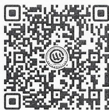
(澳门路线报名二维码)

澳门考察收费为 360 元/人(含往返交通费、保险费、考察费、水费等费用)，报名人员根据自身需求扫描下方二维码进行线上报名，每人限报 1 条路线。考察人员未能确定时间的，请不要随意扫码占用考察名额。