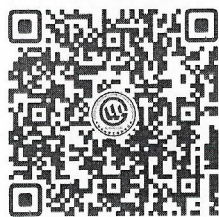
(深圳路线报名二维码)

深圳路线均为免费路线，不收取任何费用，报名人员根据自身需求扫描下方二维码进行线上报名。考察未能确定时间的，请不要随意扫码占用考察名额。